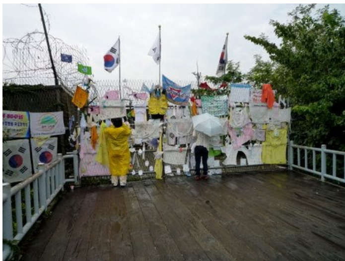
写真：韓国 DMZ の自由の橋